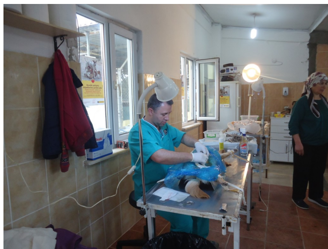
Vangen, steriliseren en terugplaatsen