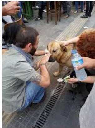
Verzorging hond belaagd met traangas