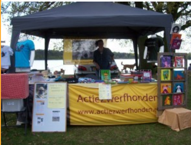
De Podencometing was weer een succes!

Nog steeds worden er door de verschillende gemeentes op grote schaal honden gedumpt in de bossen. Vrijwilligers proberen de uitgehongerde honden regelmatig van voer te voorzien maar het is nooit genoeg om te voorkomen dat er dieren van de honger zullen sterven.